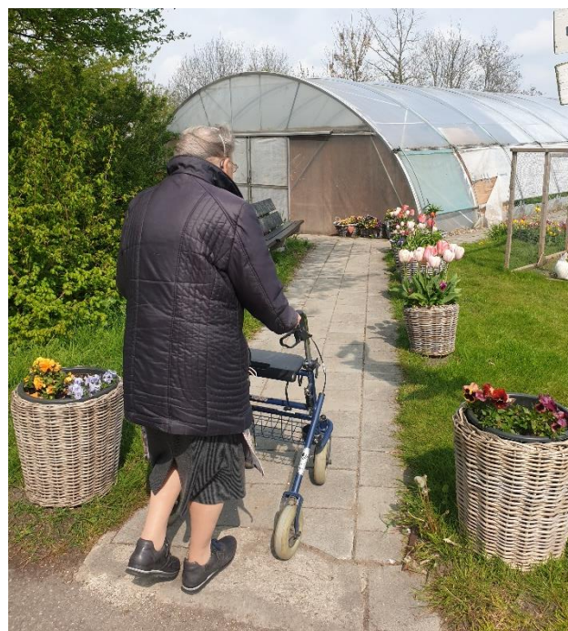
Op weg naar de kas