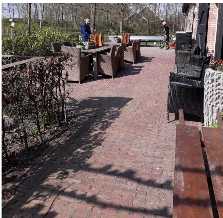
De stoelen staan weer op het terras,