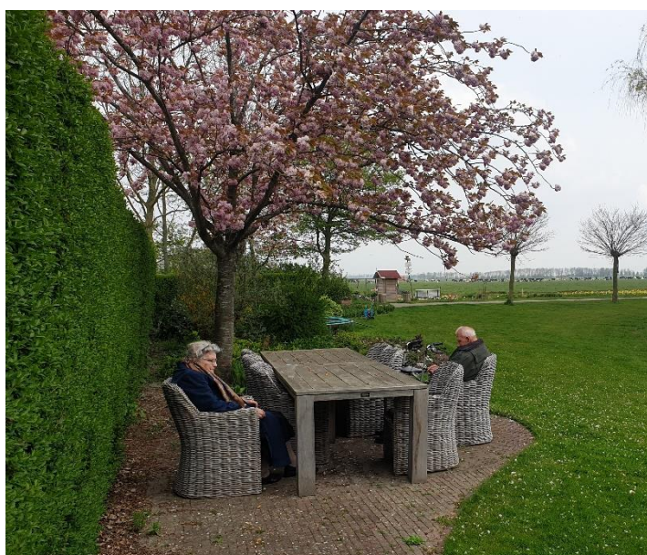
Heerlijk buiten in de tuin