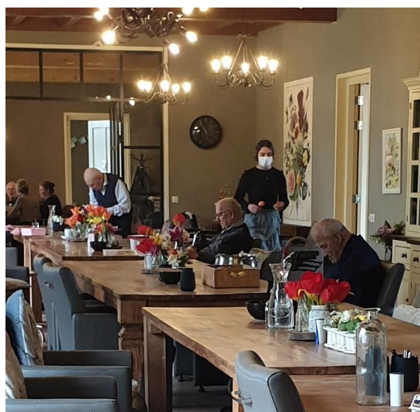
s morgens de voorbereidingen voor de warme maaltijd