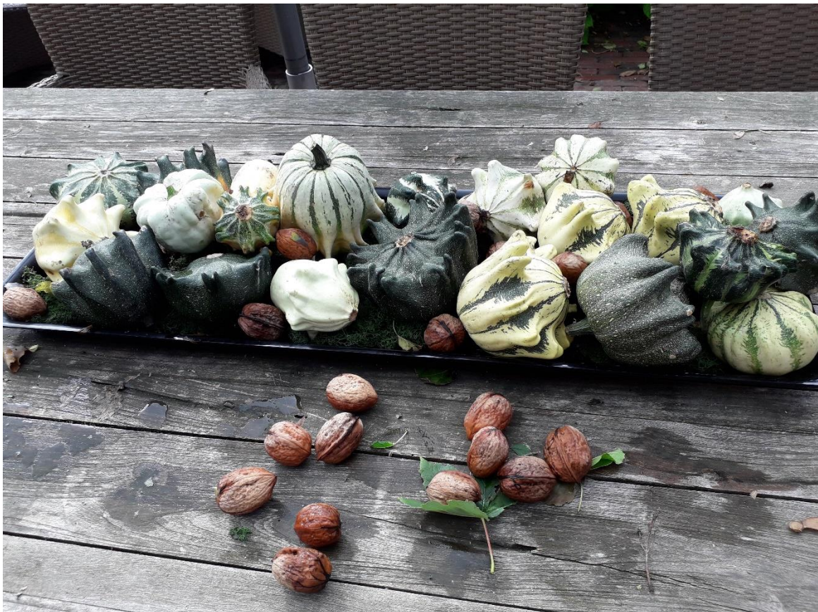
Een mooi stukje buiten op tafel