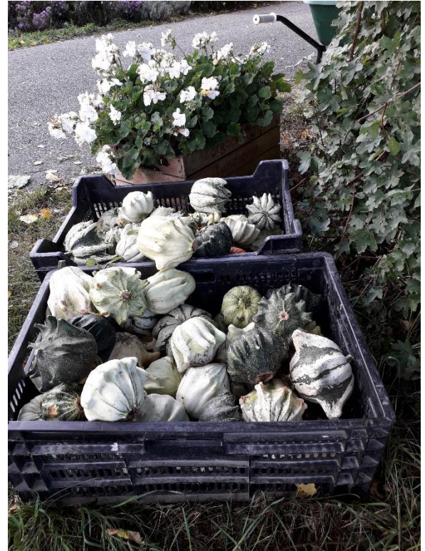
Ella bezig met het verwerken van de kalebassen.