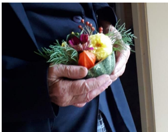
Een bloemstukje gaat mee naar huis.