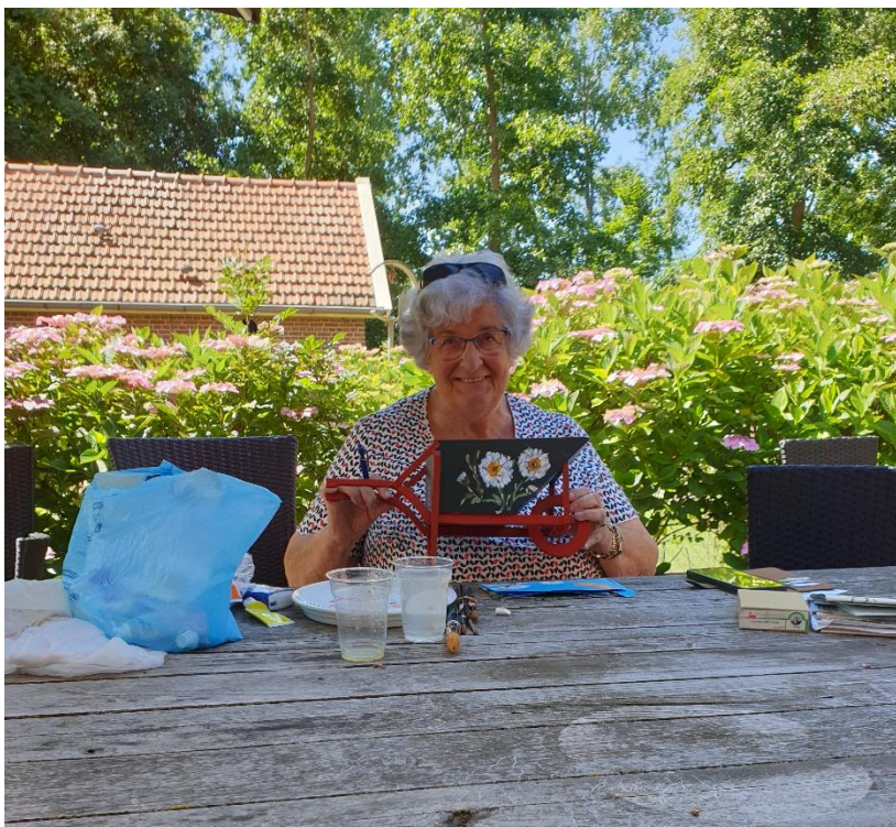
Een kruitwagen die gemaakt is in de werkplaats krijgt een mooie kunstschildering